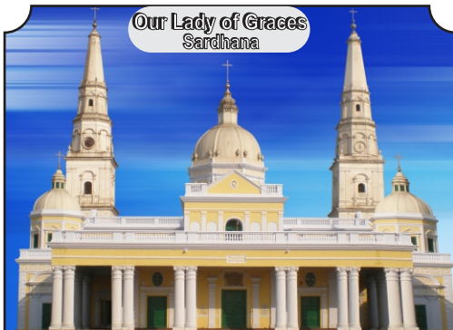
Our Lady of Graces Sardhana

6) Next Sunday's Liturgy will be animated by St. Francis of Assisi SCC and SHC Youth SCC Units at 9:00 am and 10:15am mass respectively.